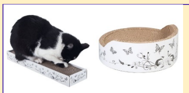
Kartonnen krabdozen: voor de horizontale krabbers!

Ook kun je kokosmatten gebruiken om de krabbehoefte van je kat te stillen. Deze kun je ophangen, maar je kunt ze ook neerleggen. Sommige katten krabben namelijk graag horizontaal. Voor deze horizontale krabbers kun je ook kartonnen krabplanken en –dozen kopen. Vaak vinden ze die ook heerlijk.