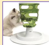
Een andere manier van eten: werken voor de kost!

Op www.hersenenwerkvoorkatten.nl kun je nog veel meer ideeën vinden.