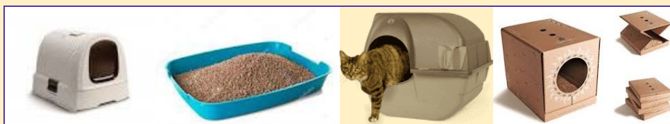
Verschillende kattenbakken: dicht en met klep, open, zelfreinigend en weggooi.

Oudere katten kunnen moeite hebben met een hogere instap. Een lage instap is dan aan te raden.