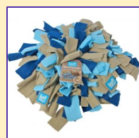
Een snuffelmatje: zoeken naar brokjes.

Veel katten vinden het prettig om gedurende de dag steeds kleine beetjes te eten. Brokjes kun je bijvoorbeeld de hele dag laten staan. Deze manier van voeren is niet voor elke kat geschikt, sommige katten blijven eten totdat alles op. In de handel kun je ingenieuze bakken kopen die op een timer opengaan. Je kunt dan de kat wel diverse keren per dag voer aanbieden, maar dan in kleine porties.