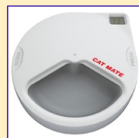
Voerautomat op timer.

Veel katten vinden het prettig om gedurende de dag steeds kleine beetjes te eten. Brokjes kun je bijvoorbeeld de hele dag laten staan. Deze manier van voeren is niet voor elke kat geschikt, sommige katten blijven eten totdat alles op. In de handel kun je ingenieuze bakken kopen die op een timer opengaan. Je kunt dan de kat wel diverse keren per dag voer aanbieden, maar dan in kleine porties.