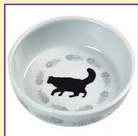
Een plat aardenwerk, 'no nonsense'-schaaltje.

Wat voor voerbakjes je koopt, is afhankelijk of je je kat blikvoer, vers vlees of brokjes geeft. De meeste katten vinden aardenwerken voerbakjes het prettigst. Plastic bakjes zijn dan wel makkelijk schoon te houden, toch trekt de smaak van het voer er snel in. Sommige katten vinden roestvrijstalen bakjes eng. Kies een ondiep schaaltje. Katten vinden het vervelend als hun snorharen tijdens het eten steeds tegen de randen van het schaaltje komen. Katten met een stompe neus, zoals Perzisch langharen, hebben veel moeite met diepere bakjes. Zij willen het liefst eten van een plat bord.